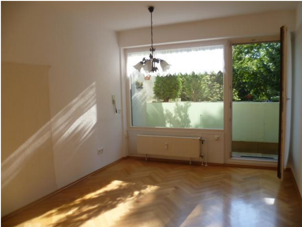
ARBEITS-, KINDER-, ESSZIMMER