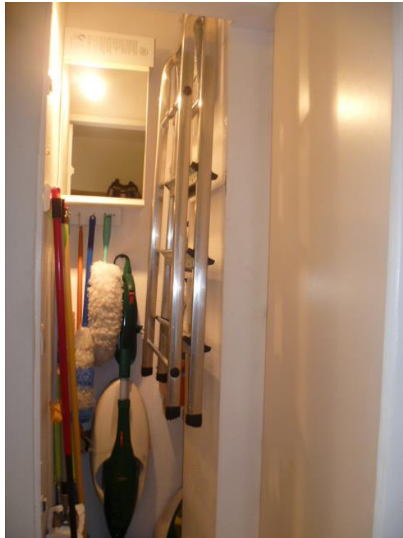
GANZ WICHTIG - ABSTELLKAMMER