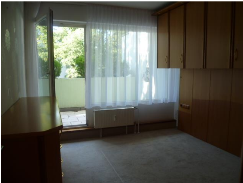
DRITTES ZIMMER MIT BALKONZUGANG