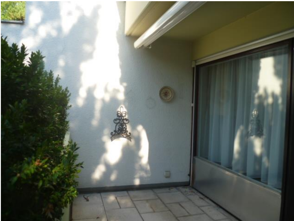
...ZUGANG ZUM SÜDBALKON