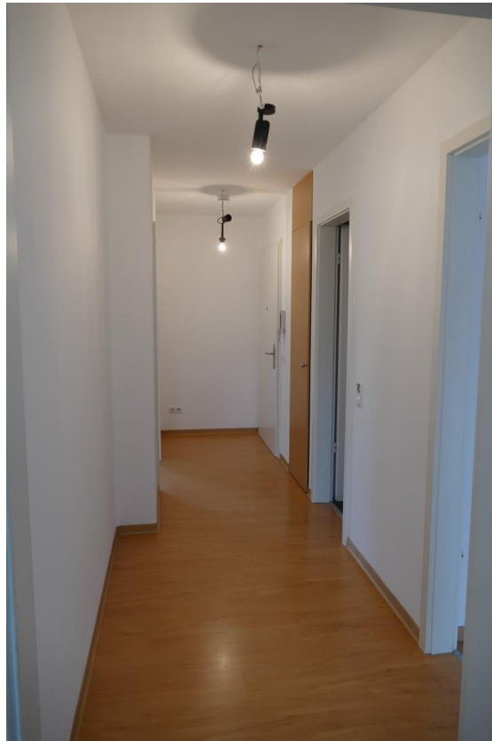
Flur mit Zugang zu allen Zimmern