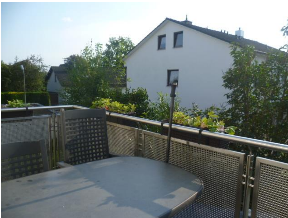
SW-Balkon mit Blick ins Grüne