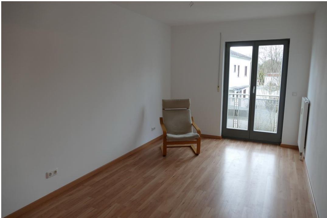
Eines der Schlafzimmer