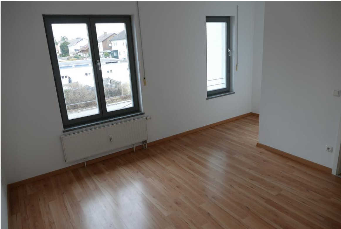
Ein zweites Schlafzimmer