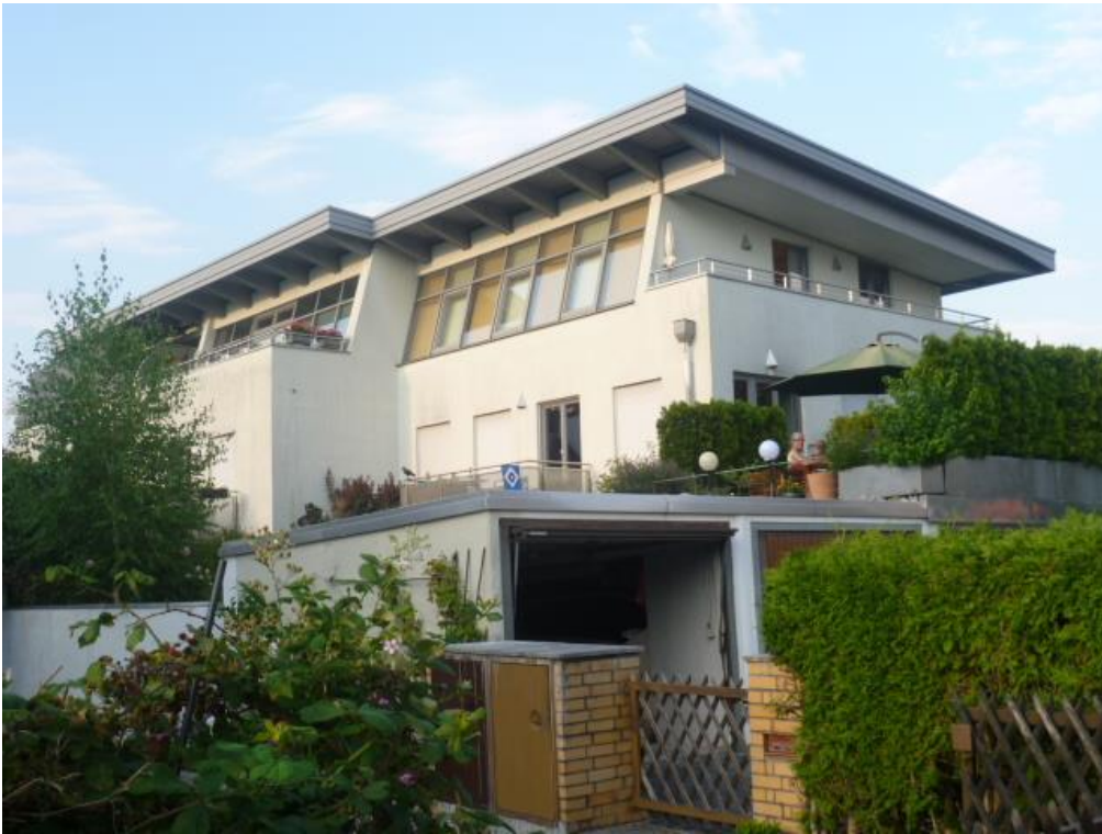
Ansicht von Südwesten