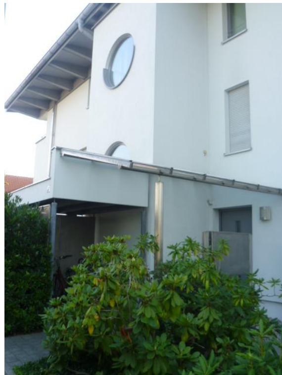
Ansicht von Nordosten