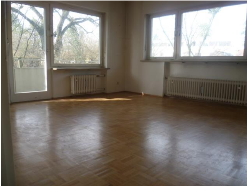
Wohnbereich mit Balkon und Gartenzutritt