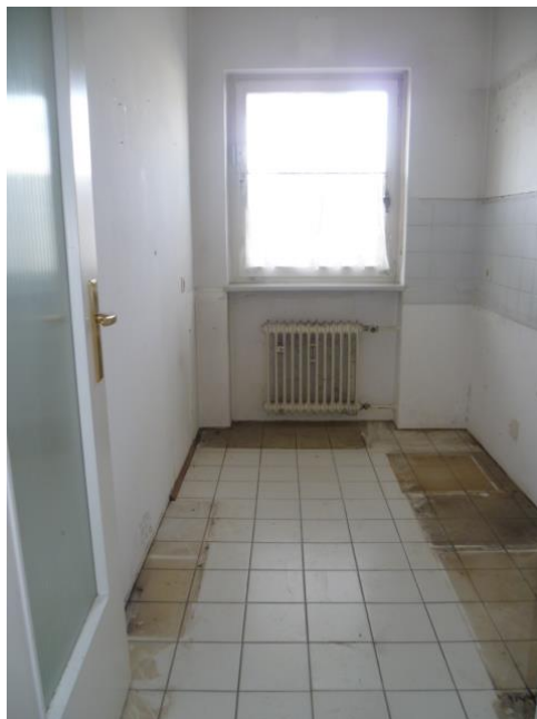
Die Küche – Haben Sie gute Handwerker?