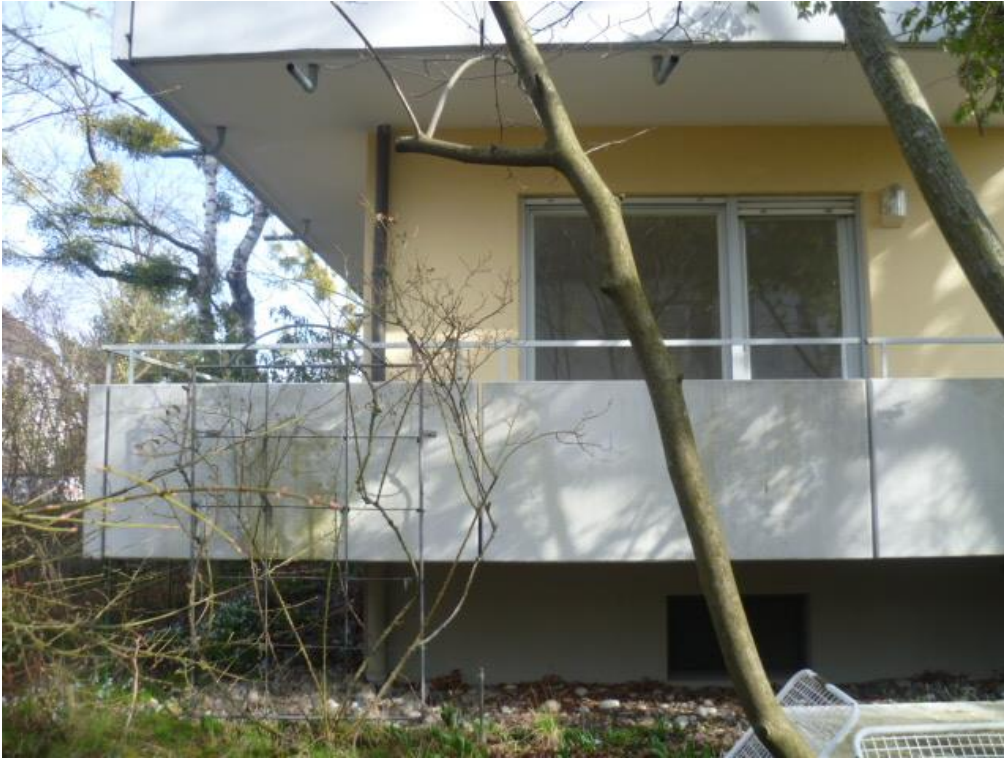
Eine idyllische Gartenlaube für gemütliche Stunden