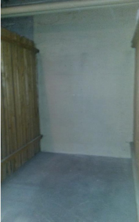
Ca. 6m 2 großes trockenes Kellerabteil