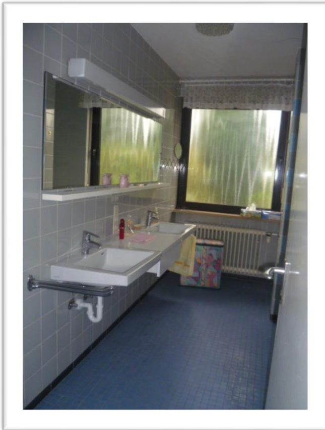
Badezimmer mit Doppelwaschbecken und separates WC