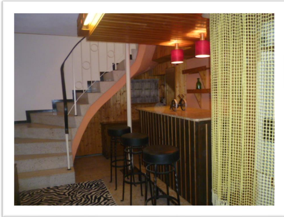
Abgang zum Keller und Waschraum