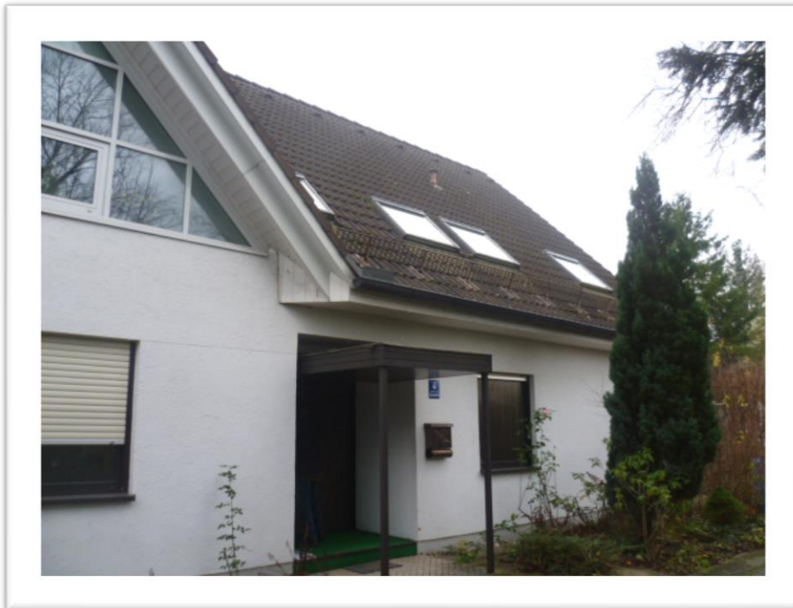
Zugang zum Hauseingang