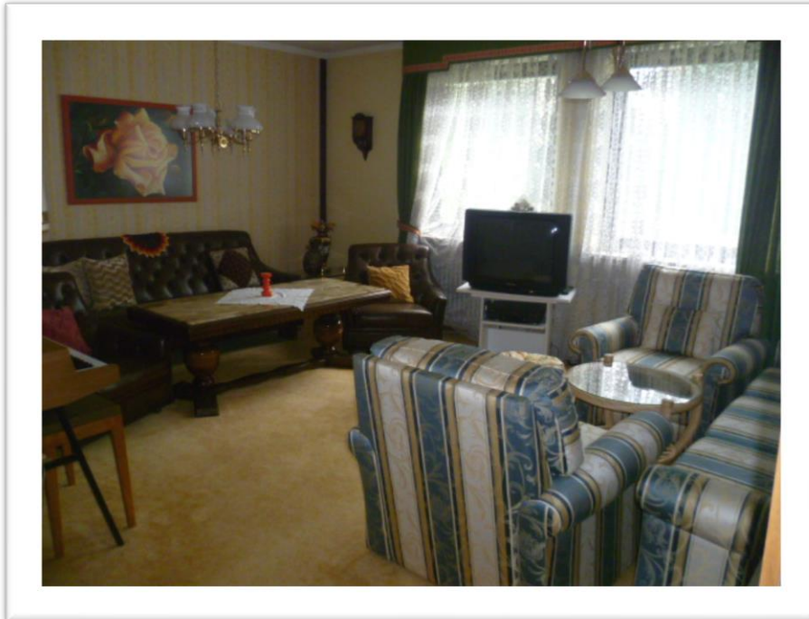
Eines der Zimmer