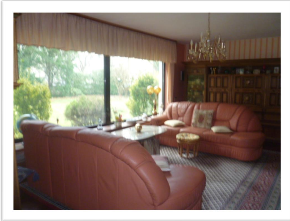
Wohn- / Essbereich