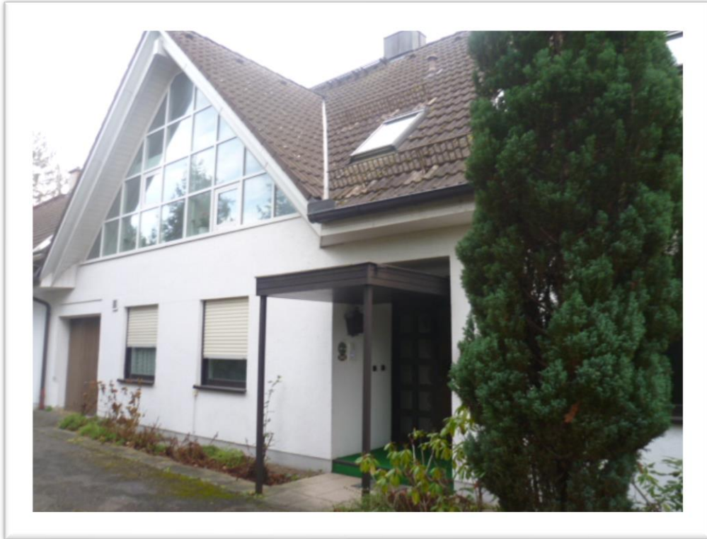
Hausansicht von Nordwesten und von Süden