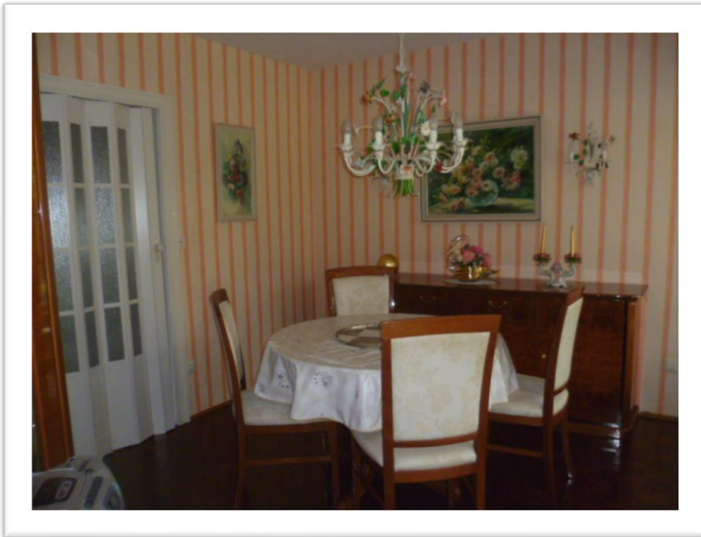
Essbereich mit Blick in den Garten