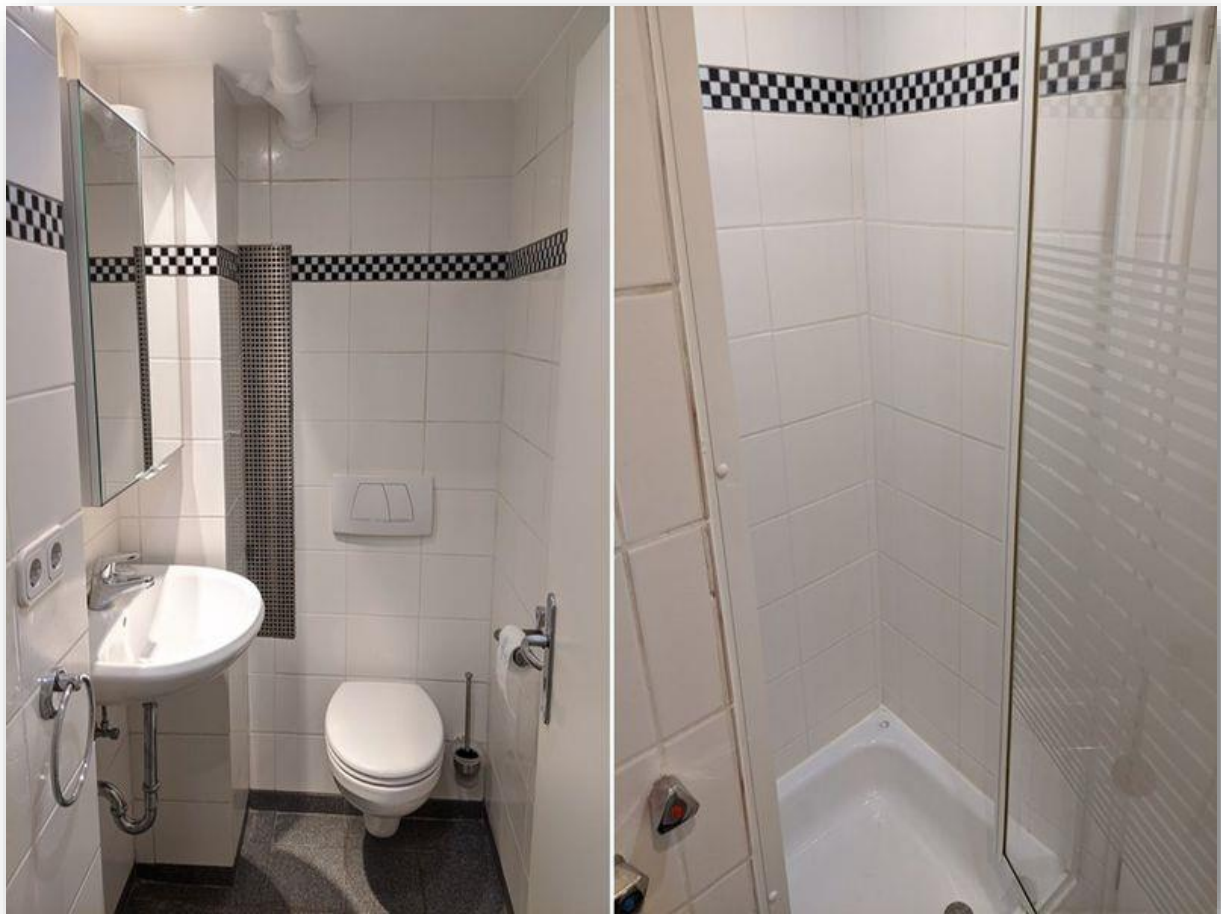
Modernes Bad mit Dusche