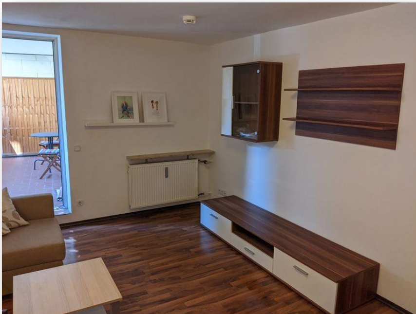
Zugang zum ruhigen Balkon