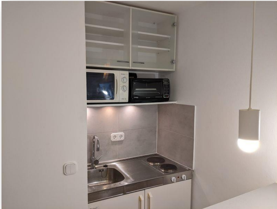
Küchennische mit Geräten