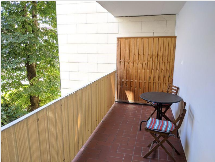
Blick auf den Ostbalkon