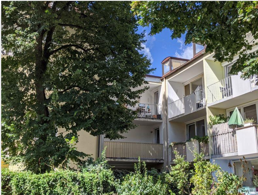
Hausansicht von Osten