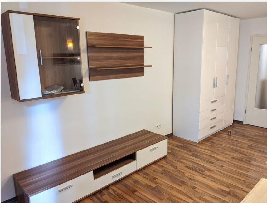
Heller Wohn- Schlafrum