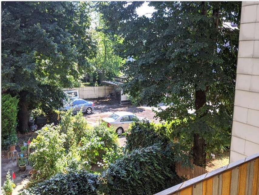
Blick in den ruhigen Innenhof